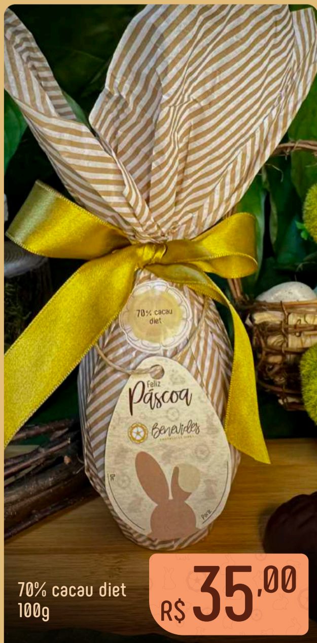
70% cacau diet 100g