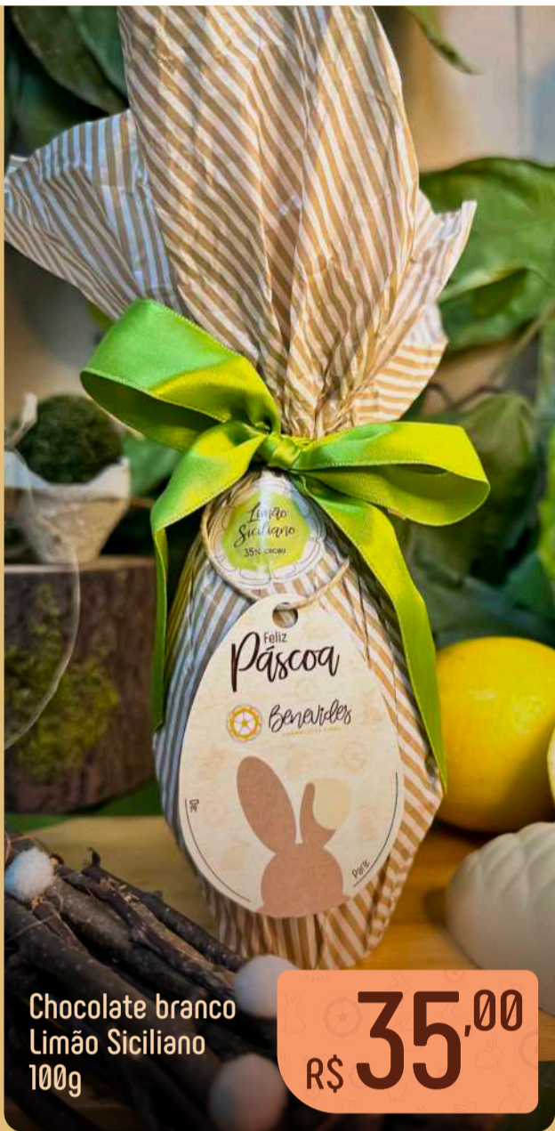
Chocolate branco Limão Siciliano 100g