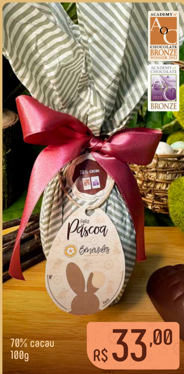
70% cacau 100g