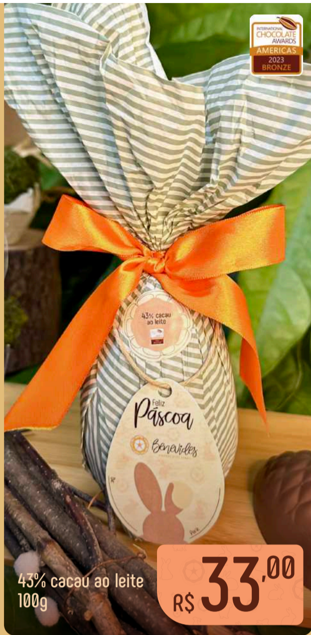
43% cacau ao leite 100g