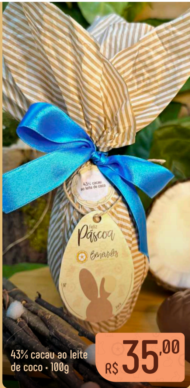
43% cacau ao leite de coco 100g