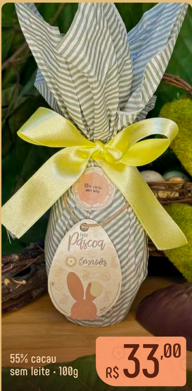
55% cacau sem leite 100g